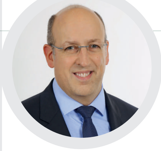
Stephan Weil Niedersächsischer Ministerpräsident